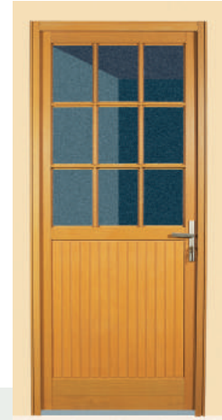
À vitrer en partie haute avec petits bois 9 carreaux