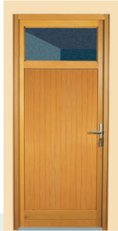
Oculus à vitrer en partie haute