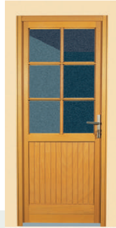
À vitrer en partie haute avec petits bois 6 carreaux